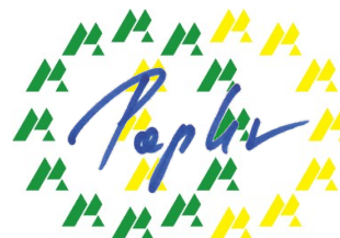
Brane Papler Umweltgutachter DE-V-0425

GUT Certifizierungsgesellschaft für Managementsysteme mbH Umweltgutachter DE-V-0213